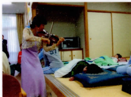
素敵なメロディーでみんなうっとり。 楽しい時間を過ごしました。